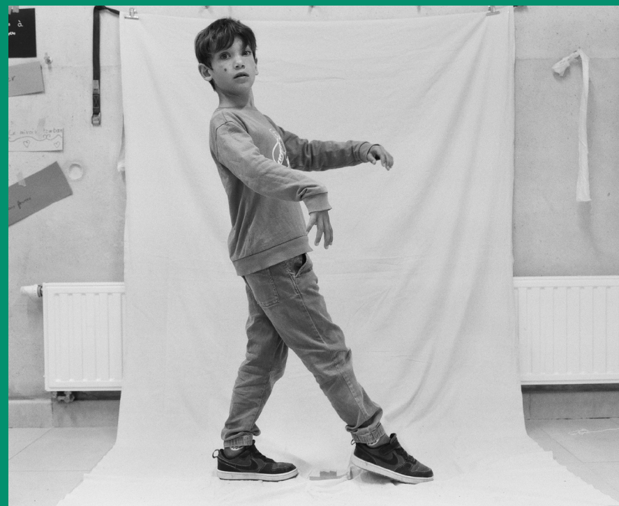
Le Grand Abécédaire des Gestes, Mathilde Claude & Marine Pistien, Création en cours, Ateliers Médicis, École primaire Marie Sagnier, Saint-Pons-de-Mauchiens.